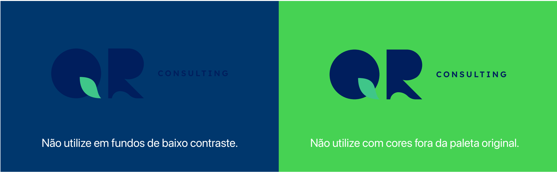
Não utilize em fundos de baixo contraste.