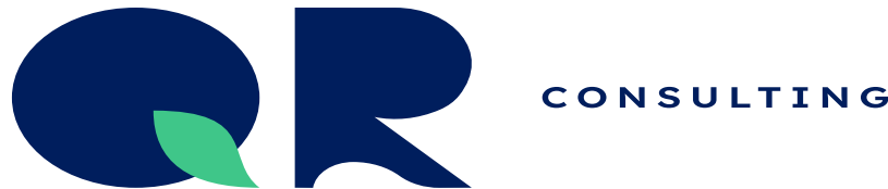
Não estique ou distorça.